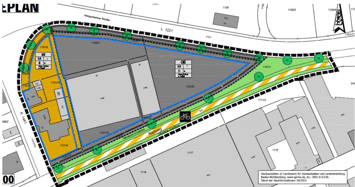
Auszug aus dem Bebauungsplan-Entwurf Stand 07.05.2021 zum Aufstellungsbeschluss

Eines der Planungsziele ist, die vorhandenen Grünflächen beiderseits des Tälesbahnradwegs planungsrechtlich zu sichern. Ein Teil der Grünfläche ist im städtischen Eigentum, der nördliche Teil (Flst. 1101/1), welcher unmittelbar an die Gewerbefläche anschließt, ist im Privateigentum.